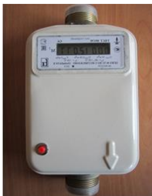
Рисунок 1 - Общий вид счетчиков газа ультразвуковых УБСГ

Общий вид счетчиков газа ультразвуковых УБСГ представлен на рисунке 1.