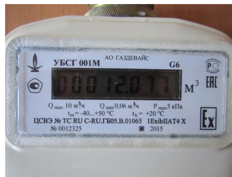
Рисунок 3 - Маркировочная табличка счетчика газа УБСГ